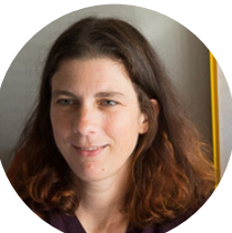
9. Sandrine Ville Innovation