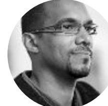
24. Ruddy Boa Soft@Home

Retrouvez la vidéo de nos candidats qui vous expliquent tout sur www.cgtfapt-orange.fr